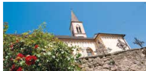
"Chiesa Parrocchiale di Aldino"

L'attuale arredamento interno in stile neogotico risale al 1897. L'altare maggiore, opera di Adolf Vogl di Hall in Tirolo, è sovrastato da un trittico con la croce in posizione centrale sopra il tabernacolo. Le varie tavole rappresentano scene delle Sacre Scritture. I due altari laterali, dedicati alla Madonna (a sinistra) ed a San Giuseppe (a destra) sono opere dell'artista gardenese Franz Santifaller . Il fonte battesimale, con il coperchio in stile neogotico, risale al 14. secolo. Una particolarità della chiesa è sicuramente il pulpito che raffigura nella parte superiore, Mosé con le tavole della legge sovrastato dallo Spirito Santo. Sul parapetto sono raffigurati in