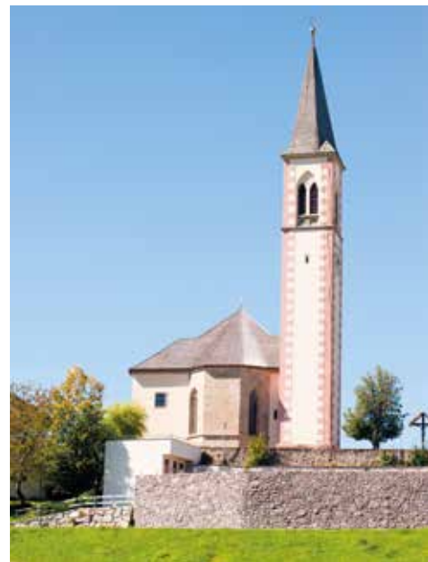
“La chiesa di Aldino”