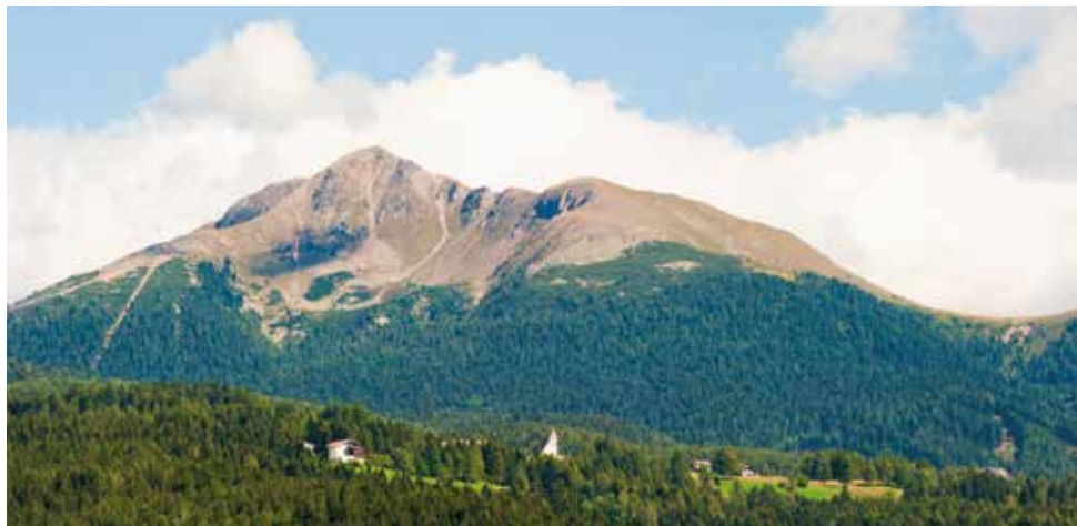
“Redagno e il Corno Nero”