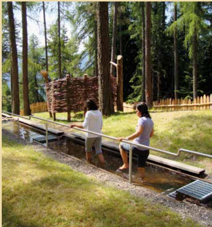
“Il Percorso Kneipp di Anterivo”