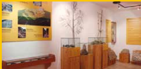
"Museo GEologico di Redagno"