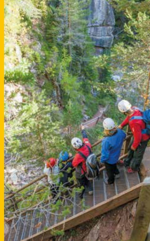
“Entrata del Bletterbach”

Tel. +39 0471 886 946, info@bletterbach.info