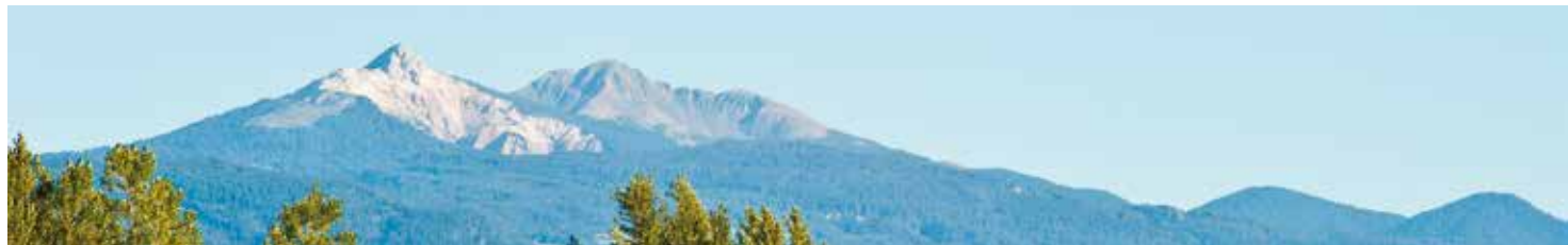
“Panorama verso Corno Bianco e Corno Nero”