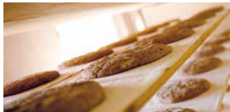
"Pane di Aldino"