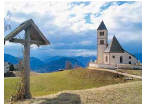
“Chiesa Parrocchiale di Redagno”

Dalla chiesa si gode una meravigliosa vista panoramica sul paesaggio e le montagne circostanti.