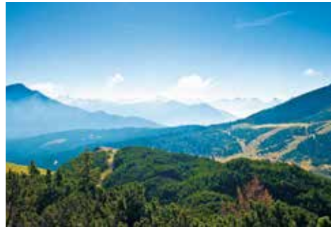
"Vista dal Corno Bianco"

che attraverso meravigliosi boschi misti sono collocate le rimanenti stazioni della Via Crucis fino al Santuario di Pietralba. Raggiunta la baita Woller iniziano i pascoli costellati di larici secolari e cosparsi di rari fiori alpini. Lasciati i prati alle nostre spalle, si raggiunge la strada forestale che attraversiamo. Ora seguiamo il sentiero numero 2 – 8 – 10 che, scendendo gradatamente, ci condurrà al rinomato Santuario di Pietralba, il più grande santuario dell'Alto Adige. Presso la chiesa si trova l'Albergo Pietralba e dietro quest'ultimo la fermata dell'autobus di linea che ci permetterà di tornare comodamente ad Aldino.