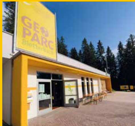
"Il Centro Visitatori GEOPARC Bletterbach®"

La tessera consente per la durata del Suo soggiorno l'accesso gratuito e illimitato al GEOPARC Bletterbach®. Informazioni presso la struttura che La ospita.