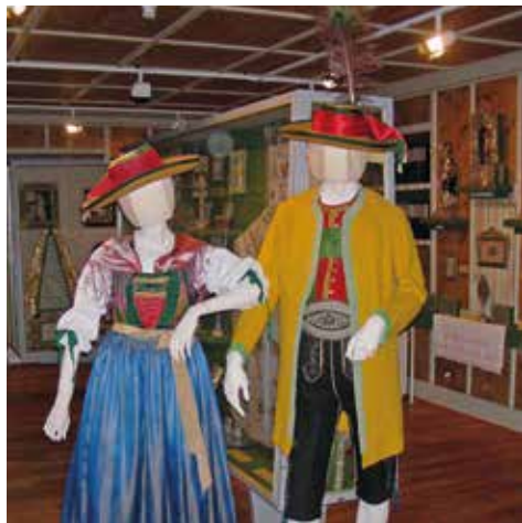
"Costume tradizionale di Aldino"