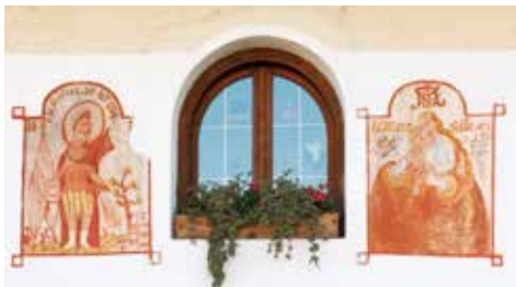
“I Santi protettori”

Due lapidi di marmo sulla parete sinistra ricordano due rinomate personalità di Aldino. Dal 1986 in una piccola urna davanti al monumento riposano i resti del grande teologo Johann Baptist Franzelin . Dopo la visita alla chiesa parrocchiale, si consiglia di visitare anche il piccolo cimitero ricco di croci in ferro battuto e la cappella cimiteriale a forma esagonale risalente al 19. secolo. È dedicata alla Maria Addolorata e sulle pareti esterne sono applicate delle lapidi in memoria dei caduti .