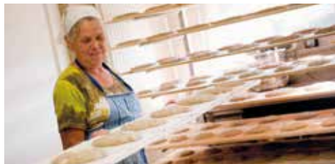
"... e fornaia"