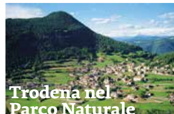
Trodena nel Parco Naturale