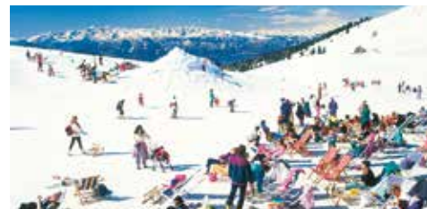
“Area sciistica familiare Passo Oclini”