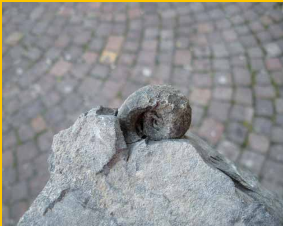
"Gasteropode fossile Bellerophon"

La tessera consente per la durata del Suo soggiorno l'accesso gratuito e illimitato al GEOPARC Bletterbach® Infor- mazioni presso la struttura che La ospita.